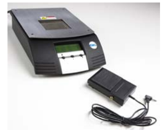
PCT-1000 mit Fußschalter