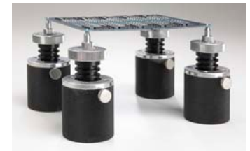
Höhenverstellbare Füße mit Stiften