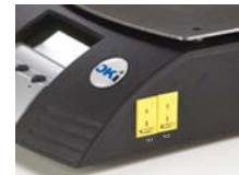
Eingangsbuchsen für externe Typ K-Thermofühler